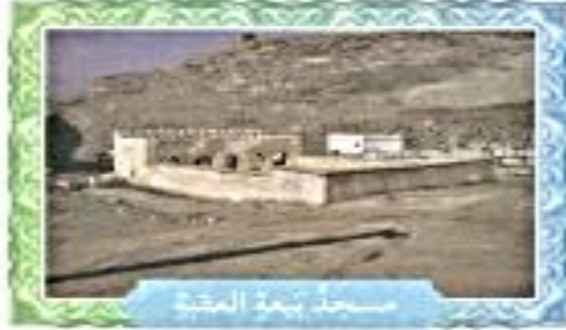
مسجد بيعة العقبة