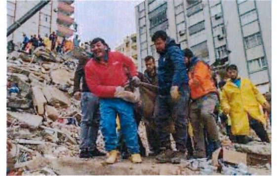
أكثر من ٤٤ ألف قتيل في سوريا وتركيا

هذا وقد ارتفعت حصيلة ضحايا الزلزال المدمر الذي ضرب تركيا وسوريا إلى ٤٤ ألف قتيل، في حين ضربت هزة أرضية جديدة اليوم وسط تركيا بقوة ٥,٥ درجة وبعُمق ١٠ كيلومتراً، وتتواصل جهود الإنقاذ وسط تساؤل الأمل في الحصول على ناجين.