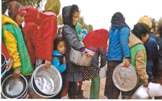
انهيار الأمن الغذائي والصحي لضحايا الزلزال

وفي سوريا، التي مرّقتها بالفعل الحرب الأهلية المستمرة منذ أكثر من عقد، كان العدد الأكبر من قتلى الزلزال في مناطق شمال غرب البلاد، التي تسيطر عليها قوات المعارضة، مما أدى إلى تعقيد جهود توصيل المساعدات إلى الناس التي تعاني الفقر والجوع ونقص كبير في متطلبات الحياة الكريمة أصلاً.