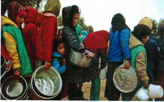
انهيار الامن الغذائي والصحي لضحايا الزلزال

وفي سوريا، التي مزقتها بالفعل الحرب الأهلية المستمرة منذ أكثر من عقد، كان العدد الأكبر من قتلى الزلزال في مناطق شمال غرب البلاد، التي تسيطر عليها قوات المعارضة، مما أدى إلى تعقيد جهود توصيل المساعدات إلى الناس التي تعاني الفقر والجوع ونقص كبير في متطلبات الحياة الكريمة اصلا".