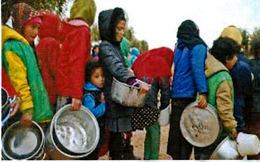
انهيار الامن الغذائي والصحي لضحايا الزلزال

وفي سوريا، التي مزقتها بالفعل الحرب الأهلية المستمرة منذ أكثر من عقد، كان العدد الأكبر من قتلى الزلزال في مناطق شمال غرب البلاد، التي تسيطر عليها قوات المعارضة، مما أدى إلى تعقيد جهود توصيل المساعدات إلى الناس التي تعاني الفقر والجوع ونقص كبير في متطلبات الحياة الكريمة اصلاً".