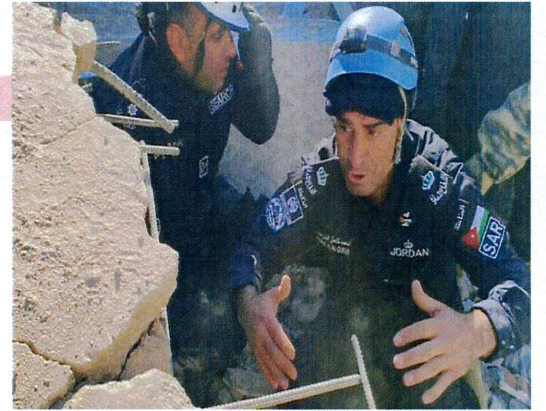
جهود الاردن تتواصل في تقديم المساعدات

تجدر الإشارة الى أن الاردن كان دائما السباق في مساعدة الأشقاء في سوريا خلال فترة الحرب الاهلية وكانت الاردن هي المنفذ الوحيد في تقديم المساعدات على مر السنين، حيث يعي الاردن أهمية إيصال الجهود الإغاثية والمساعدات الى الاشقاء في سوريا كون أن الوضع الإنساني لديهم لا يحتمل أي تأجيل وذلك تجنباً لمزيد من الفقر والجوع والبطالة والتشرد.